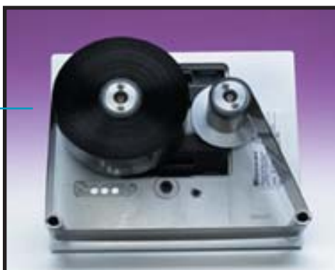
Casete de cinta sencillo para cambios fáciles

BATCH : AZ37YY1 PROD : 08A05 14:55 OP ID : 1895A