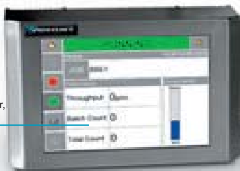
Pantalla táctil a color, de 8 x 4 pulgadas