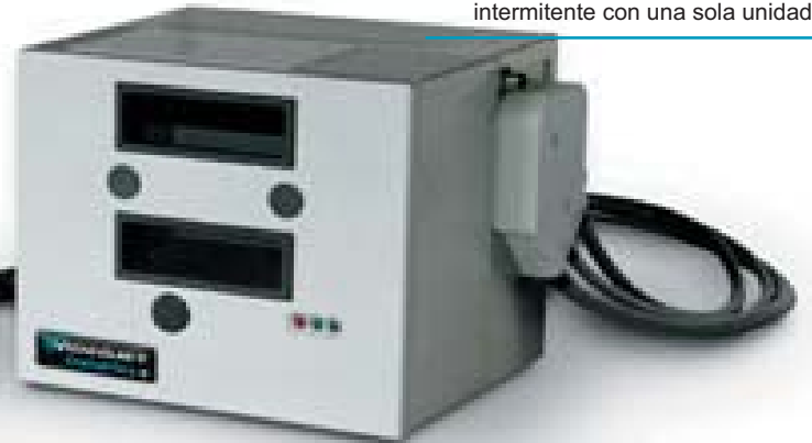
Funcionamiento en continuo e intermitente con una sola unidad